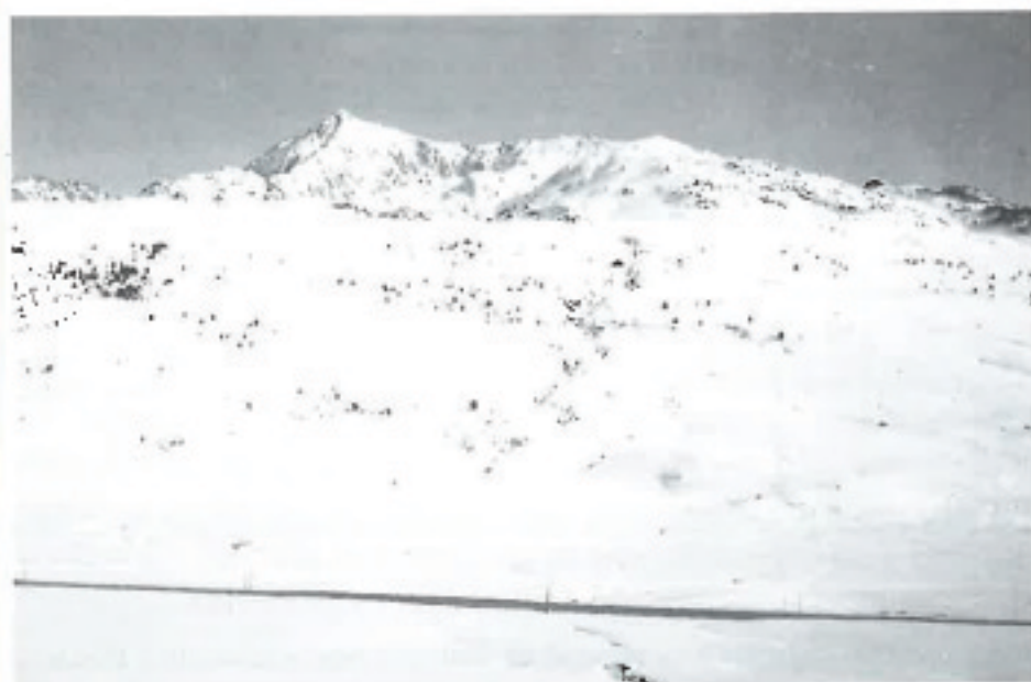
Pla de Boet

Per fi després de 3 anys de treballs, les màquines ja han acabat la seva feina. La nefasta pista d'Àreu al Pla de Boet ja és història. Ara, finalment, es pot arribar com Déu mana a Boet. És una magnífica obra, una via ràpida de dos carrils per banda que et porta en 10 minuts de Llavorsí al Pla i amb un peatge de només 700 pts.